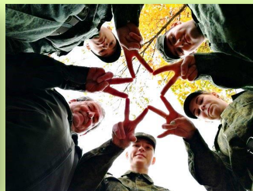
«Стремимся к звездам»