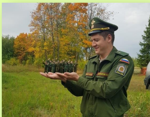
«Весь взвод на ладони»